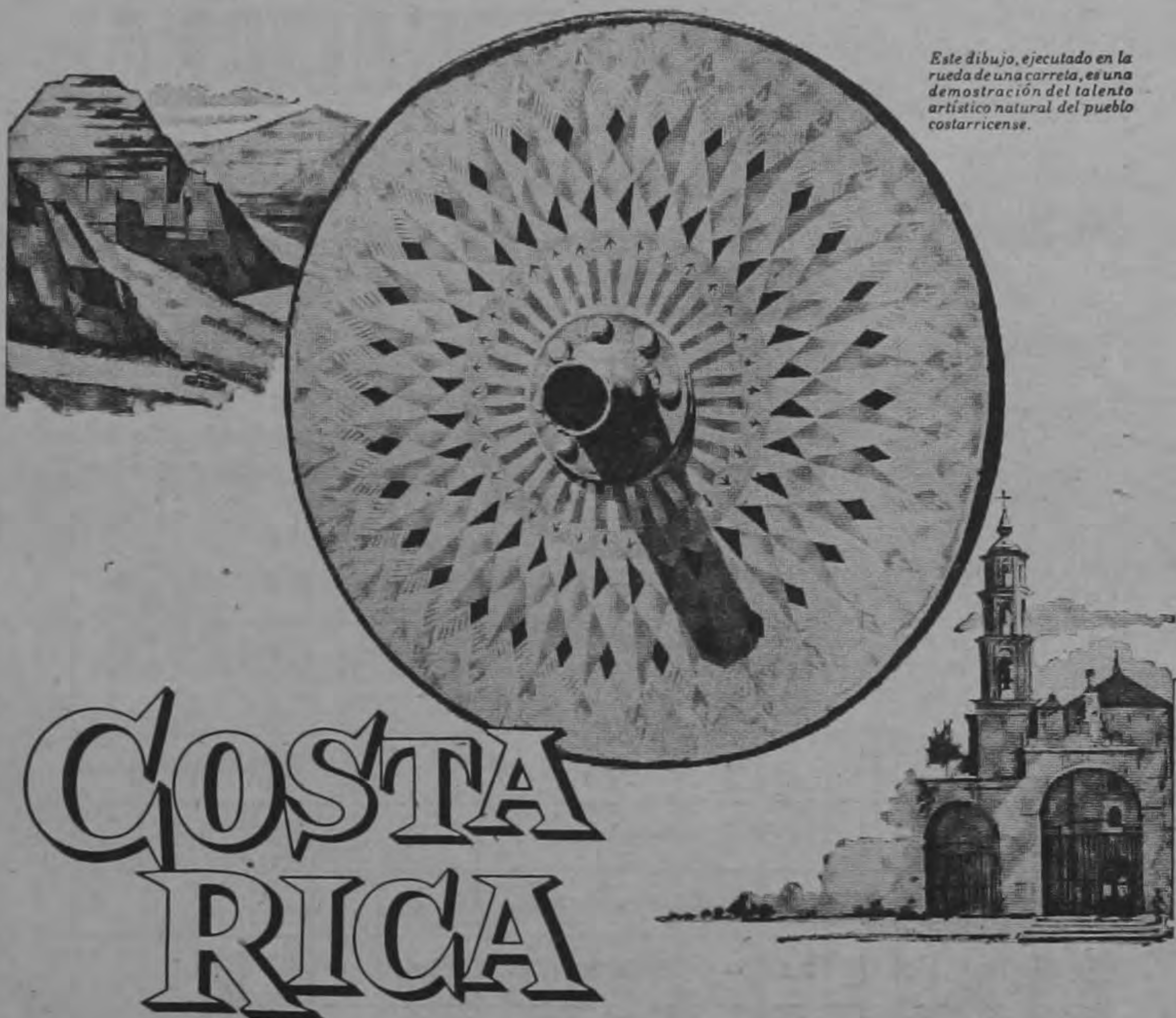
Este dibujo, ejecutado en la rueda de una carreta, es una demostración del talento artístico natural del pueblo costarricense.